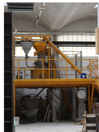
Atelier de Génie Civil

Le stage de fin d'études peut être effectué à l'étranger (se rapprocher du service des relations internationales).