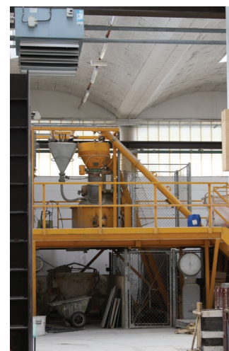
Atelier de Génie Civil